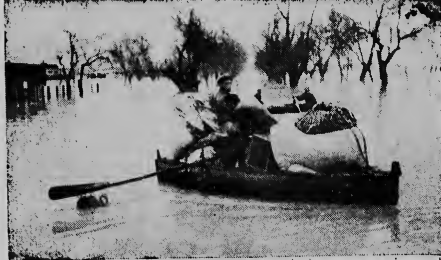
Una Anagnusia, zuid di Spanja hopi rieuwnan a jena di mas te basha over, causando hopi estorbo. Danjo material a pasa millones di pesetas. Riba e foto aki un bista di eva- cuacion di Lora del Rio.

Se ha dicho que el caracter es el destino, es decir, la historia. Si es así cuales son los factores basicos que, en comun con el resto de la humanidad, condiciona la evolu- cion historica de los pueblos de la América Latina? Qué es lo que de- termina fundamentalmente su ca- racter?